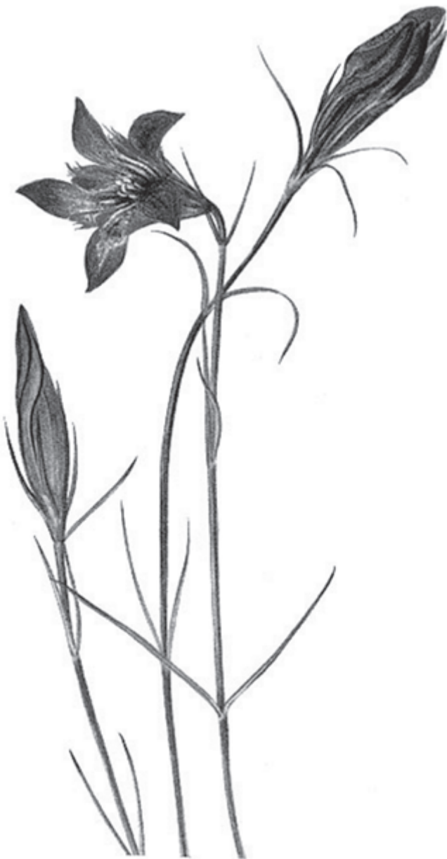
Genitana (Long-Dan-Cao) kühlt Hitze und trocknet Feuchtigkeit

Die Ausbildung in chinesischer Pharmakologie und Pflanzenheilkunde beinhaltet das Erlernen der Einzelkräuter und den Unterricht in den klassischen Rezepturen. Um eine bessere Verbindung zur klinischen Anwendung der Arzneien und Rezepturen zu lehren, werden in dieser Ausbildung im ersten Teil die 16 Gruppen der chinesischen Pharmakologie kompakt mit den wichtigsten Einzelkräutern dargestellt und in einem zweiten Schritt die Rezepturen entlang der in der Praxis am häufigsten vorkommenden Erkrankungen der Zang und Fu-Organen gelehrt. Ziel der Ausbildung ist es, aus dem weiten Feld der chinesischen Pharmakologie einen komprimierten und praxisnahen Kern herauszuschälen, mit dem man einen großen Teil der täglichen klinischen Arbeit am Patienten bewältigen kann.